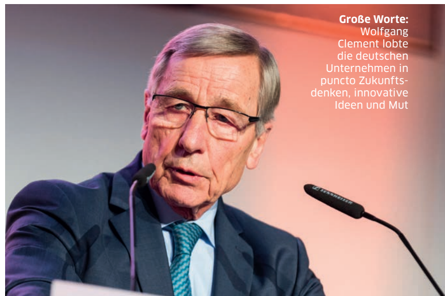
Große Worte: Wolfgang Clement lobte die deutschen Unternehmen in puncto Zukunftsdenken, innovative Ideen und Mut